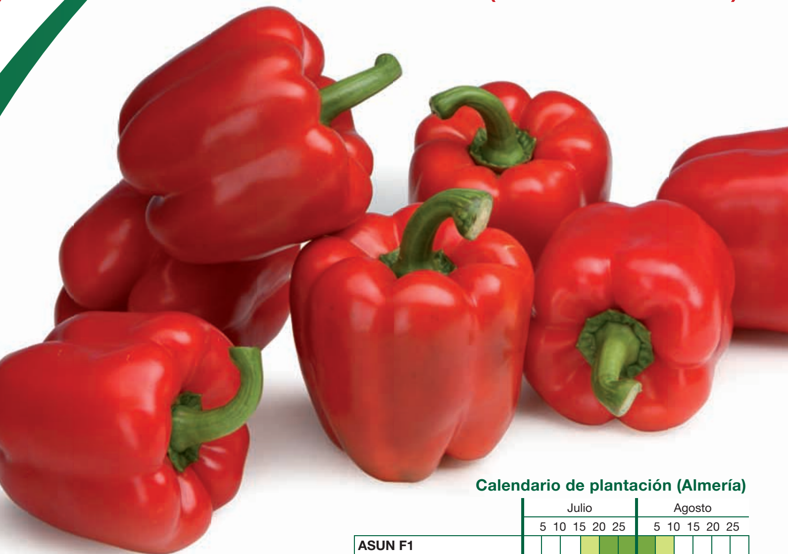
Calendario de plantación (Almería)