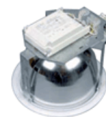
Luminaire with ECG.