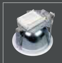
Luminaria completa con Balastro Electrónico