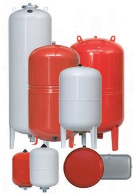
Vasos de expansión