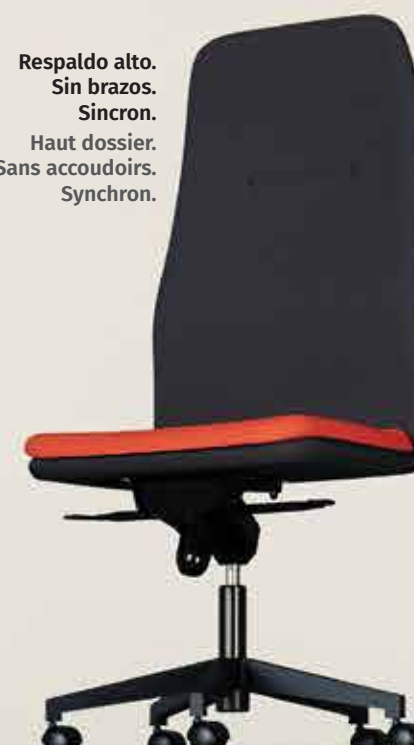
Respaldo alto. Sin brazos. Sincron. Haut dossier. Sans accoudoirs. Synchron.