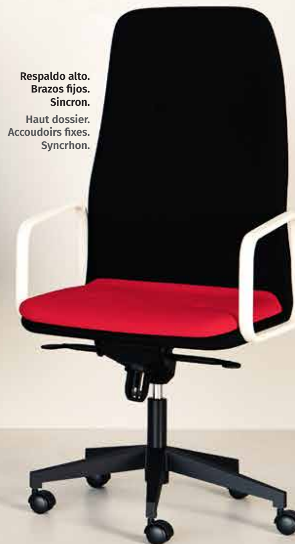
Respaldo alto. Brazos fijos. Sincron. Haut dossier. Accoudoirs fixes. Synchron.