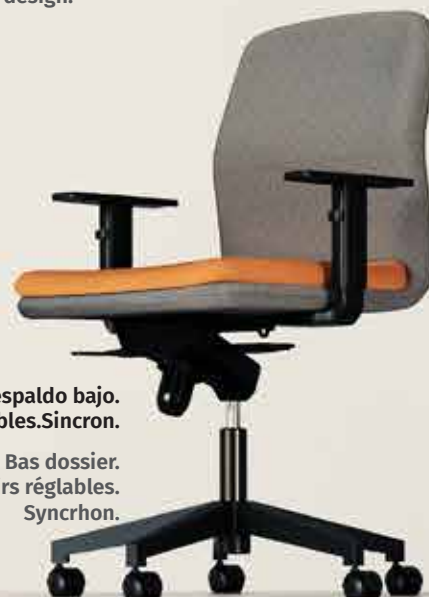
Respaldo bajo. Brazos regulables.Sincron. Bas dossier. Accoudoirs réglables. Synchron.