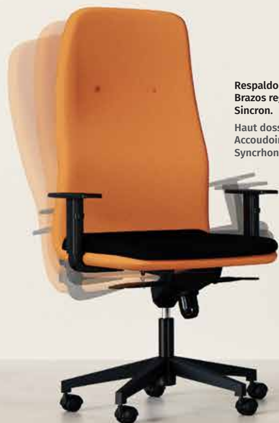
Respaldo alto. Brazos regulables. Sincron. Haut dossier. Accoudoirs réglables. Synchron.

- Haut dossier et bas dossier. - Base avec roulettes ou traîneau, pour adapter la conception à des postes de travail ou confident.