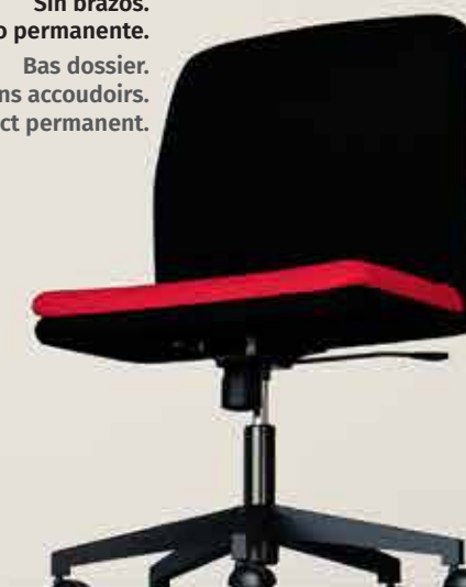
Respaldo bajo. Sin brazos. Contacto permanente. Bas dossier. Sans accoudoirs. Contact permanent.