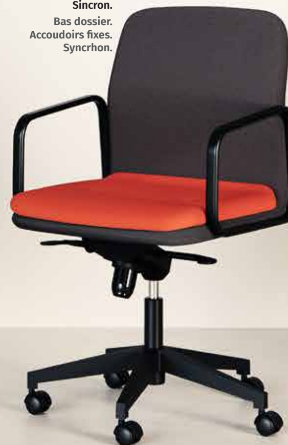
Respaldo bajo. Brazos fijos. Sincron. Bas dossier. Accoudoirs fixes. Synchron.