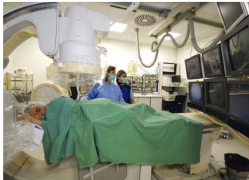
Servicio de Neuroangiografía Terapéutica J.J. Merland