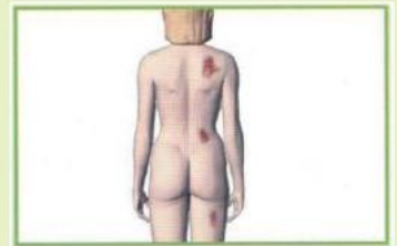
Curación de heridas